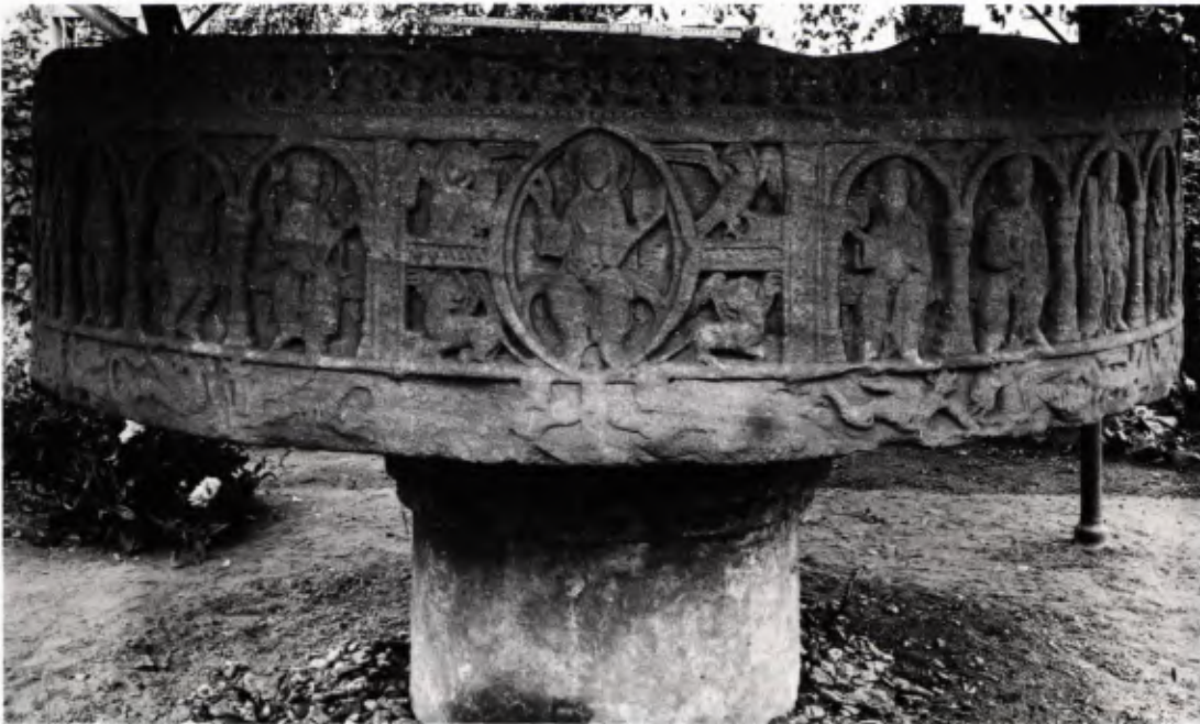
2 Der „Teufelsstein“, Aufstellung im Pfarrgarten. Aufnahme um 1910.