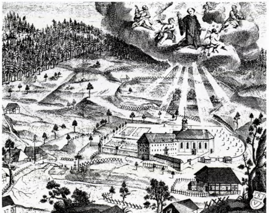
1 Der „Teufelsstein“ im Prioratsgarten von St. Ulrich, nach dem Neubau von 1740ff. Stich von Peter Mayer zu: Philipp Jakob Steyrer, Leben und Wunder-Thaten des heiligen Udalrici ... Freiburg 1756 (Titelbild).

Als Brunnen im Zentrum eines Kreuzganges erscheint die St. Ulricher Schale in einer Zeichnung, die das Kloster nach dem Übergang an St. Peter 1567 darstellt; die Zeichnung entstand allerdings erst 1758 und ist in ihrer Zuverlässigkeit nicht zu überprüfen. Sicher ist, dass es noch im 18. Jahrhundert Reste eines gotischen Kreuzganges gab. 1742 wird die Brunnenschale nach vorheriger Rundmauerung neu versetzt – also auf dem Boden aufstehend. 1746 wird eine Quelle in die Schale geleitet, 1779 erhält der „große Stein im Garten“ einen neuen eichenen Brunnenstock. Einer Schrift des St. Petriner Abtes Philipp Jakob