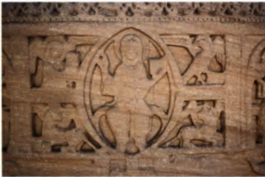
4 Darstellung der Ecclesia oder von Maria in der Mandorla.